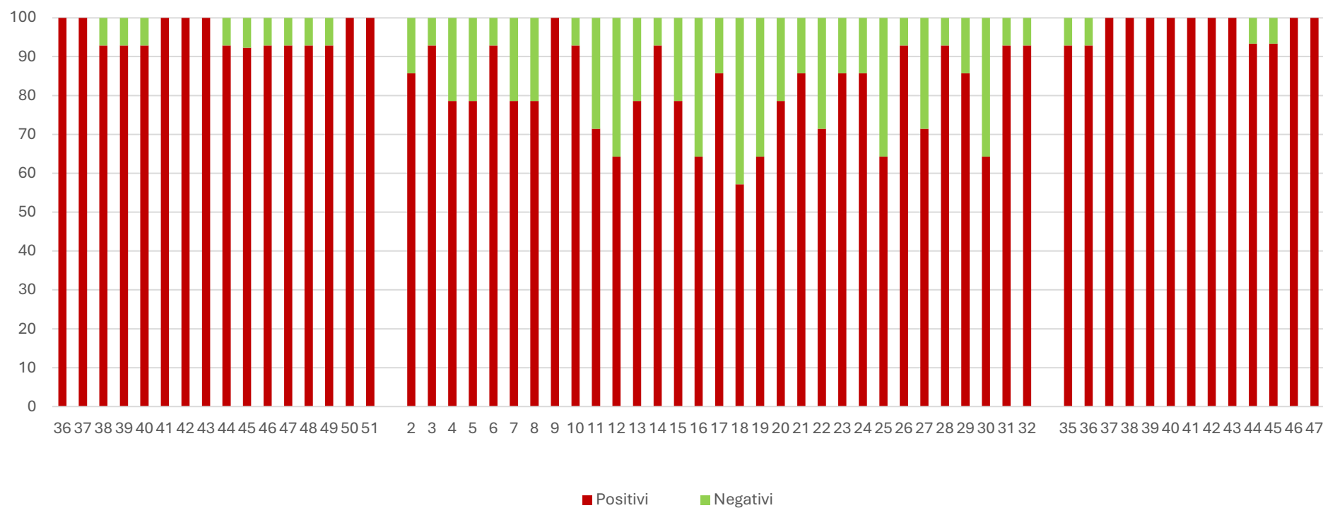
SARS-CoV2 (N1) %

I grafici seguenti mostrano i dati settimanali riportati in tabella 1 e in tabella 2, è presente un grafico per ogni virus monitorato: